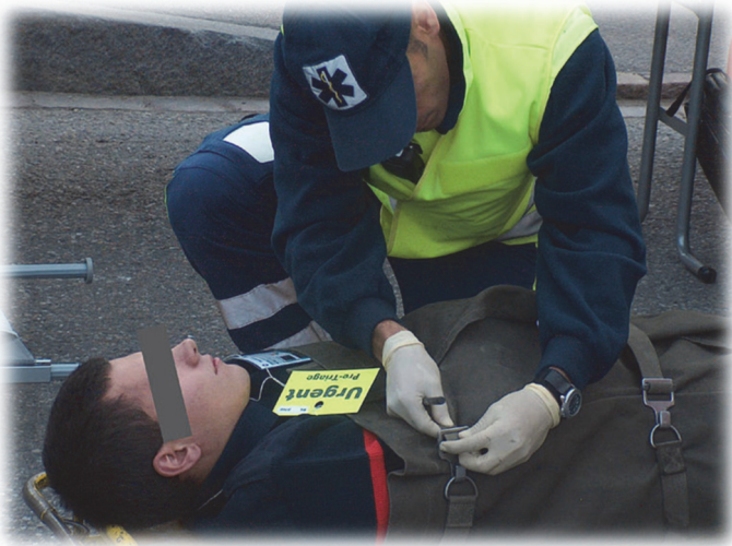
Triageübung mit Kennzeichnung eines Patientendarstellers durch Sanitäter anlässlich der Übung „Senza Limiti“ der Schweizer Feuerwehr und des Katastrophenschutzes, in Wikipedia, available at: https://commons.wikimedia.org/w/index.php?curid=5168271 (last accessed: 2024.8.25) .